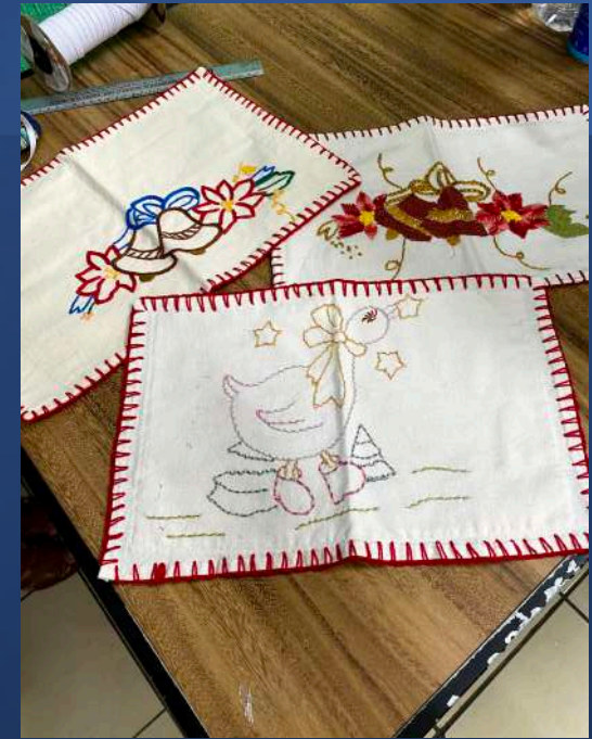
Bread Basket Towel