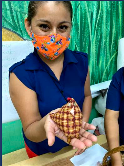
Chicken Pin Cushion